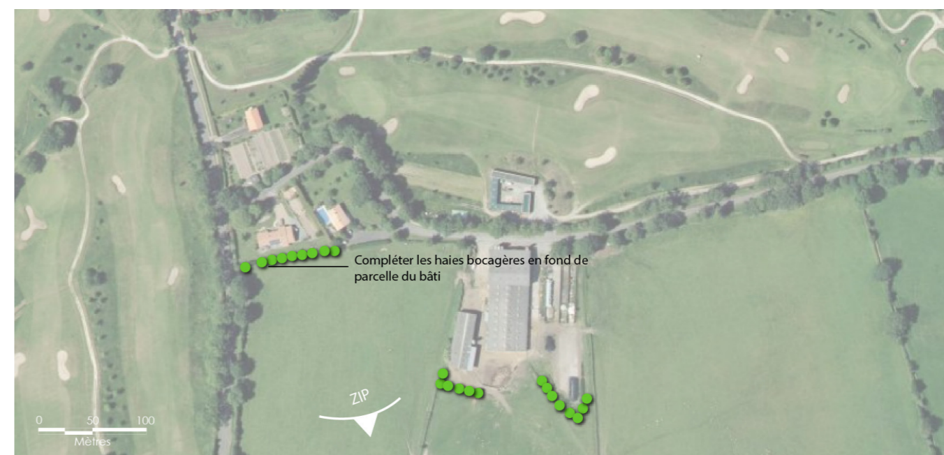
Au Sud des Forges